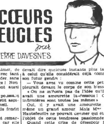
COEURS AVEUGLES par PIERRE DAVESNES