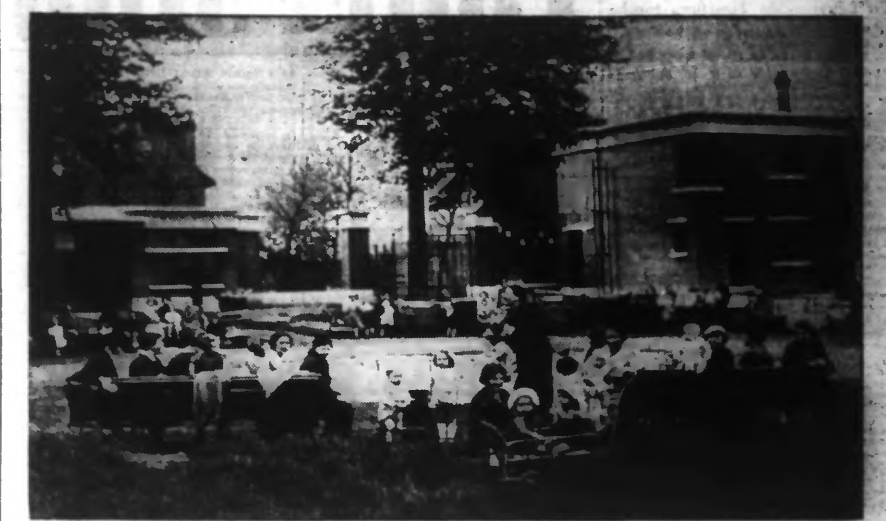
NOUVEAU AMÉNAGEMENT DU JARDIN POUR ENFANTS AU CHÊNE-HOUPLINE

RECHERCHES sur l'EPILEPSIE Dans un but scientifique, il est demandé aux malades atteints d'épilepsie de vouloir bien adresser à M. le médecin-chef du Laboratoire de Neurologie, 83, rue de la Liberté, à Lille, un échantillon d'urine à analyser. Pour que ce liquide se conserve pendant le transport, il suffit de le mettre dans un flacon en verre à bouchon spécial dont le port aller et retour est gratuit, comme l'analyse.