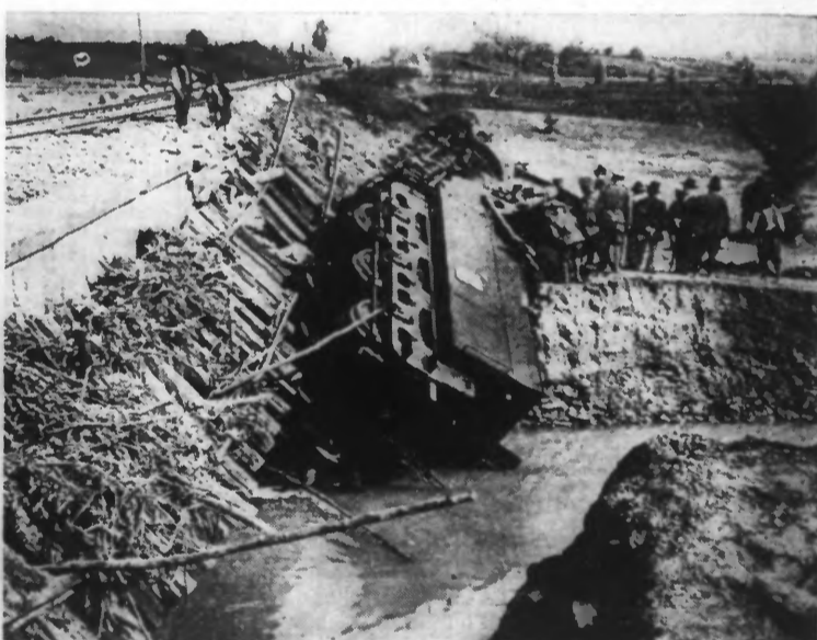
Les pluies en Roumanie ont provoqué de véritables catastrophes. L'affaissement d'un remblai a précipité dans un torrent cette machine haut-le-pied.