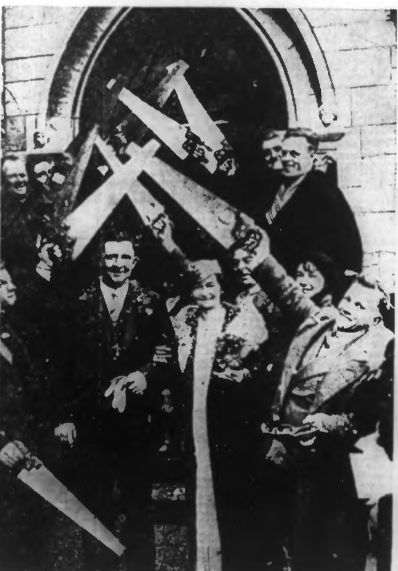
Au mariage d'un menuisier, ses camarades, chevaliers de la scie, constituent une haie d'honneur peu banale.