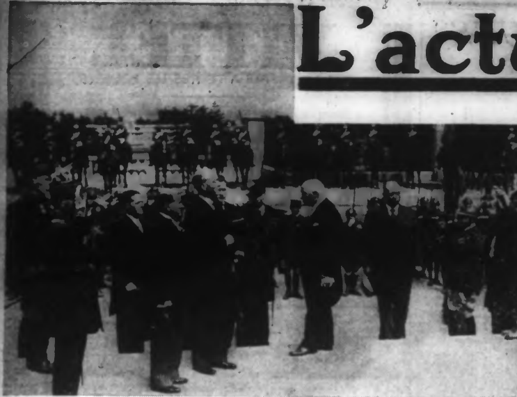
Le « Memorial Day » au cimetière américain de Suresnes. -- Au milieu, aux côtés de M. Daladier, M. William Bullitt, ambassadeur des Etats-Unis à Paris. A gauche: le général Gouraud.