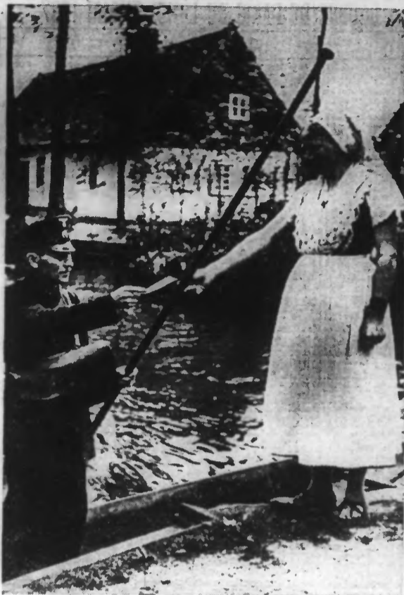
Dans le Spreewald, surnommé la « Venise allemande », le facteur fait sa tournée sur un carot.