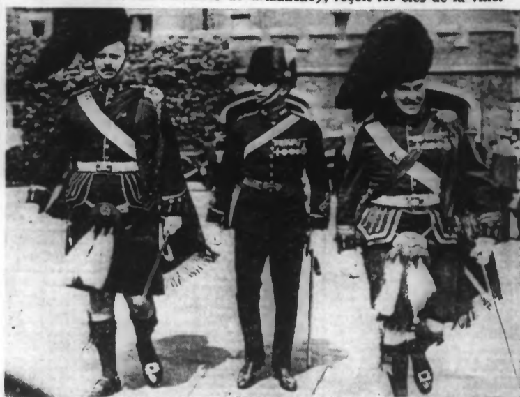
Trois highlanders canadiens arrivent à la réception offerte par la reine d'Angleterre au palais de Saint-James.