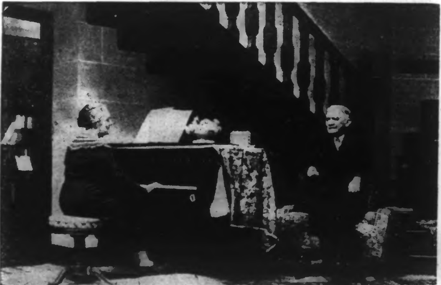
M. et Mme Doumergue dans leur saison de Tournefeuille