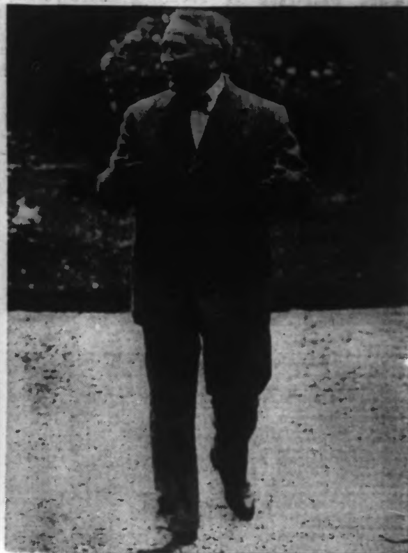
L'ancien président de la République dans sa propriété de Tournefeuille, où il s'était retiré après son septennat.