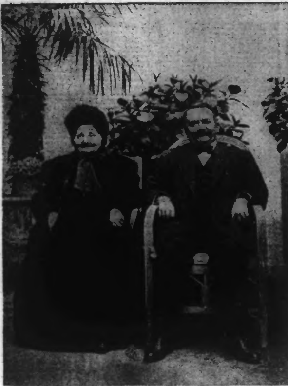
M. Gaston Doumergue et sa mère