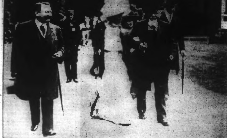
M. Doumergue, alors ministre de l'instruction publique, photographié à Versailles en 1912 en compagnie du roi Albert (au second plan, à droite), de la reine Elisabeth de Belgique et du président Fallières.