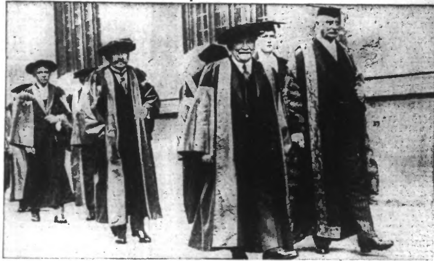
En 1927, M. Doumergue est reçu docteur « honoris causa » de l'Université d'Oxford. Derrière lui, M. Briand.