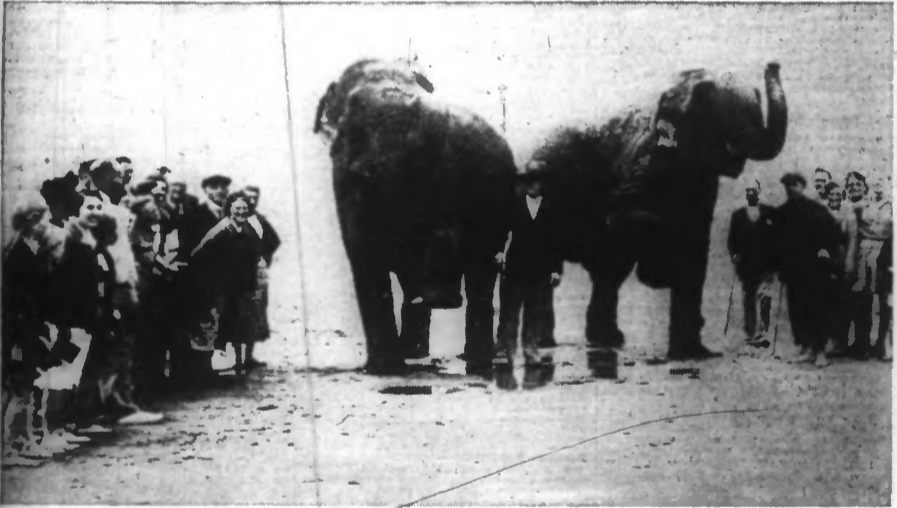
C'est une attraction de choix pour les baigneurs de la plage de Bude-en-Cornouailles, que le spectacle quotidien du bain de ce couple d'éléphants.