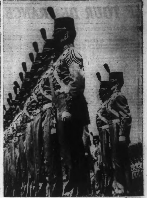
Une parade impeccable des élèves de l'Ecole militaire américaine de West-Point.