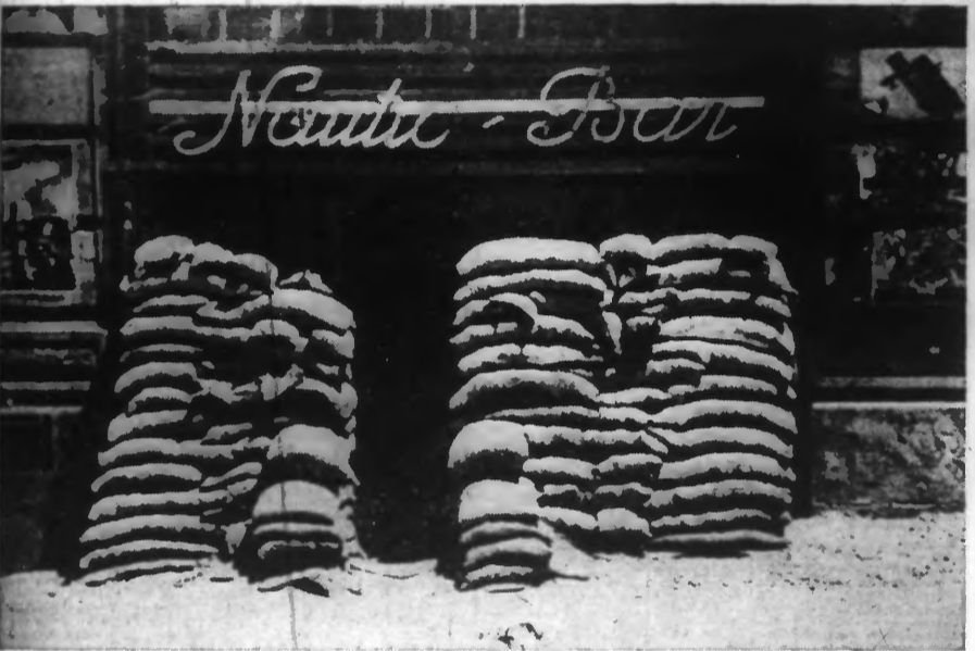
Le visage de Madrid sous le bombardement: Un bar, la façade protégée par des sacs de sable.