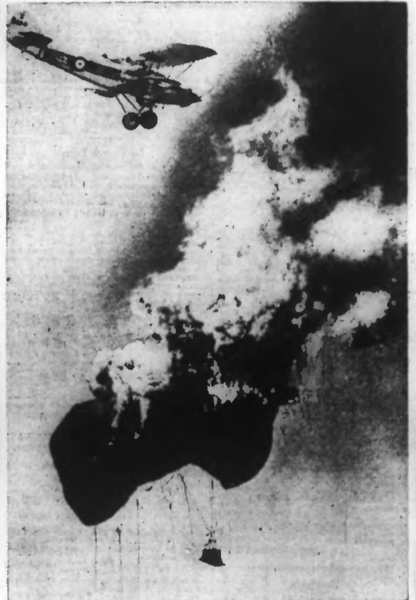
Un biplan de combat incendie un ballon d'observation au cours de la fête aérienne de Hendon.