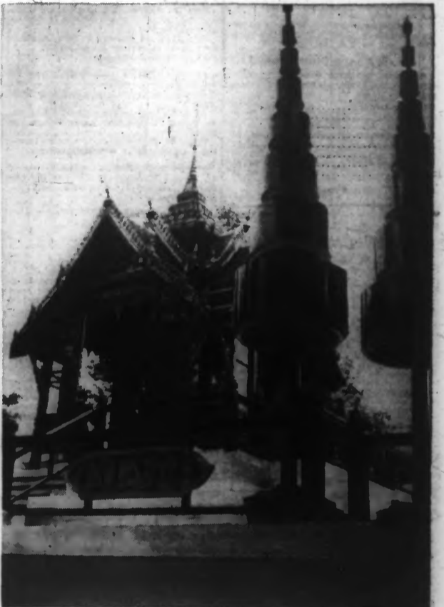
Le pavillon du Siam à l'Exposition.