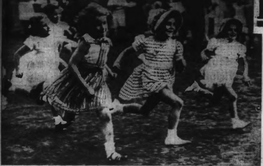
Un « sprint » acharné disputé... avec le sourire par de charmantes bambines.