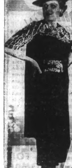
Ensemble de jersey noir garni de panthère.

Potage aux fèves. Deux litres d'eau, 250 grammes de fèves, 125 grammes de lard de poitrine, un oignon, deux pommes de terre, deux jaunes d'œufs, deux cuillerées de crème.