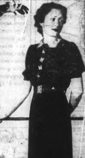
Robe de crêpe de Chine noir, entièrement plissée, garnie de boutons mousquetaires de Paris rouges, ceinture de daim rouge.

Réparation des seaux et des arrosoirs. Les meilleurs s'aient et finissent par se percer. Voici un moyen simple et peu coûteux de faire ces réparations sommaires.