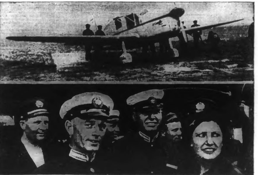
Maryse Bastié pose en compagnie d'aviateurs soviétiques au cours de son récent passage à Moscou. - En haut, l'appareil de l'intrépide aviatrice française.