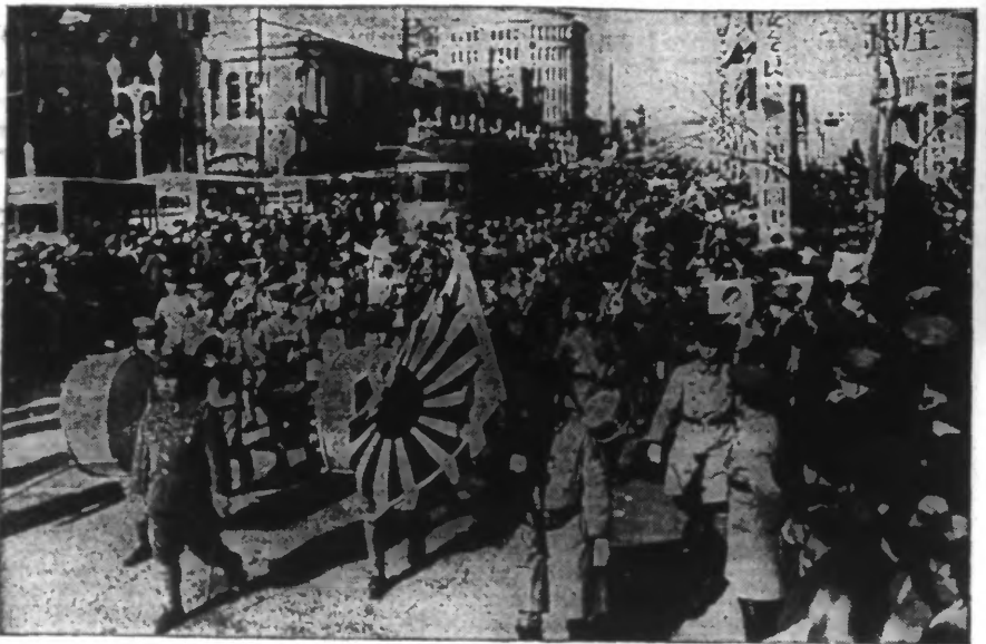
Avant de se rendre en Chine du Nord, un régiment de soldats japonais défile dans les rues de Tokio.