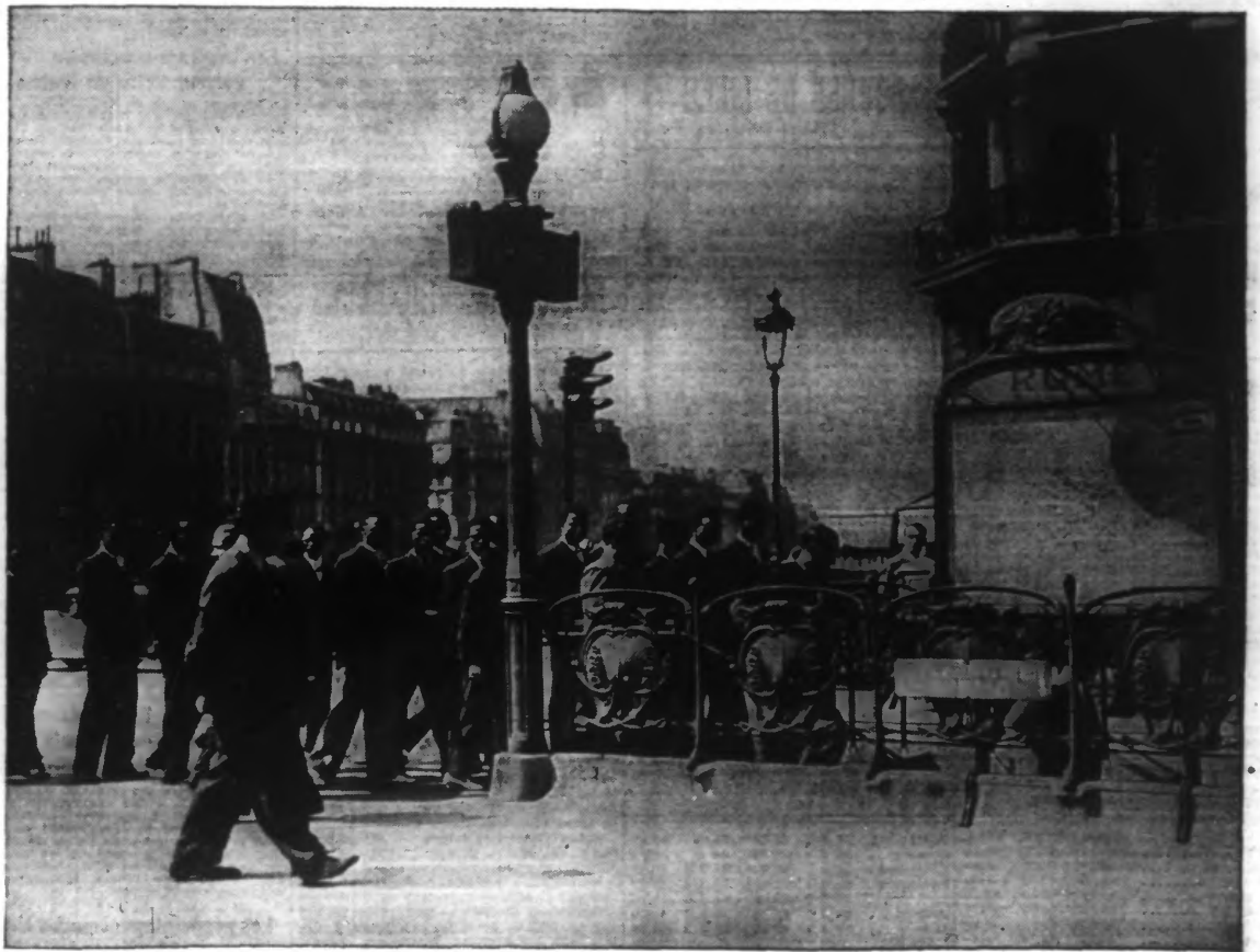
Des étudiants noirs de l'Afrique occidentale française sont arrivés à Paris, où ils participeront aux fêtes folkloriques qui se dérouleront à l'Exposition.