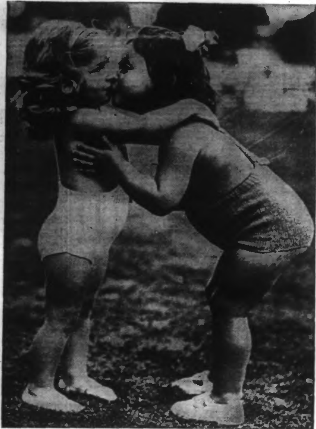
Deux concurrentes d'un tournoi de beauté enfantin qui semblent bonnes amies.