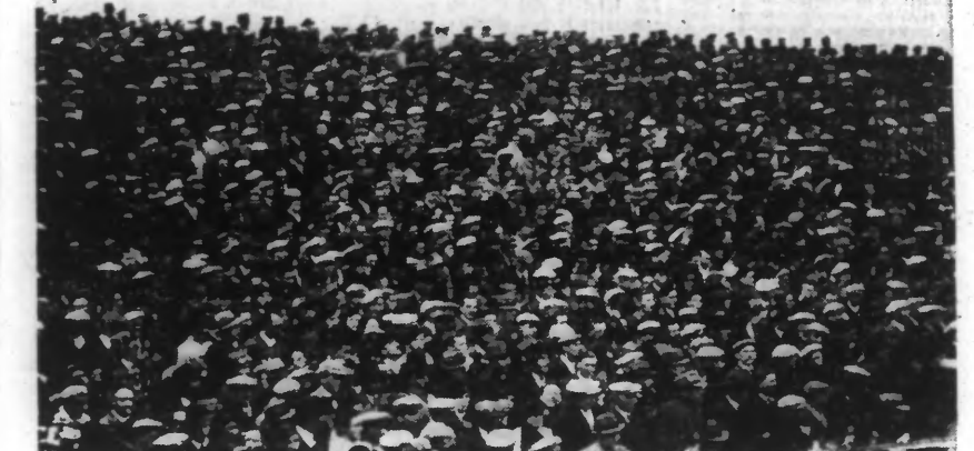
UNE PARTIE DE LA FOULE MASSÉE AUX « POPULAIRES ».