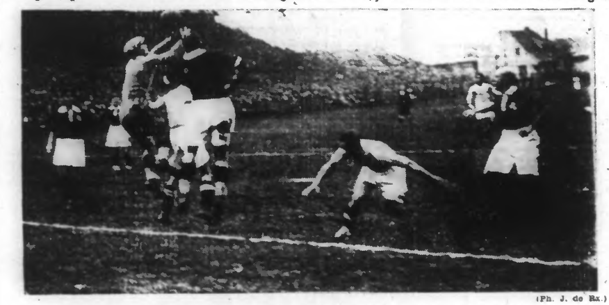
UN BEL ARRÊT DE DESPOSSÉ QUI, PROTÉGÉ PAR VANDOREN, VIENT DE FAIRE UNE SORTIE AUDACIEUSE.

Bologne, qui a fait match nul avec la Ligue de Paris, jouera la finale contre la Pologne