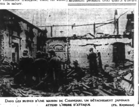
DANS LES RUINES D'UNE MAISON DE CHANGHAÏ, UN DETACHEMENT JAPONAIS ATTEND L'ORDRE D'ATTAQUE.

Un entretien de M. Mussolini avec le roi de Grèce. Rome, 2 novembre. — Le roi Georges de Grèce, qui est arrivé lundi à Rome pour une visite privée à la famille royale italienne, a été reçu l'après-midi par le Duce au palais de Venise.