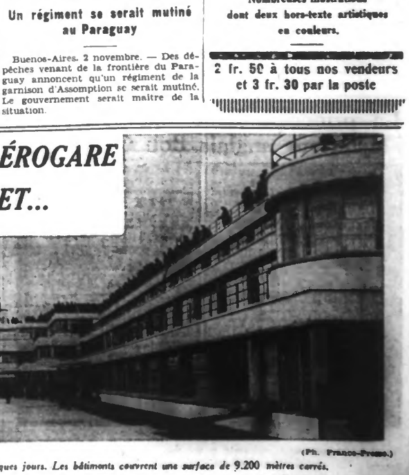
LA NOUVELLE AÉROGARE DU BOURGET... qui sera inaugurée dans quelques jours. Les bâtiments couvrent une surface de 9.200 mètres carrés.

LA NOUVELLE AÉROGARE DU BOURGET... qui sera inaugurée dans quelques jours. Les bâtiments couvrent une surface de 9.200 mètres carrés.