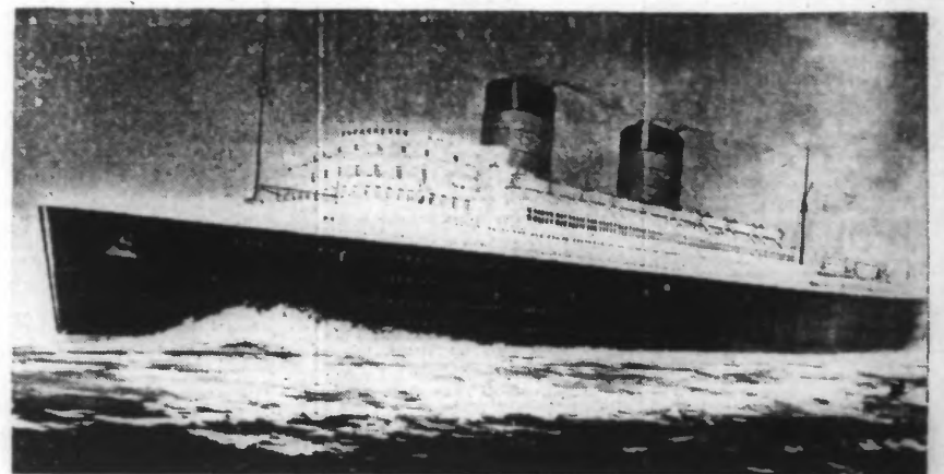
La maquette du futur transatlantique « Mauretania », de 33.000 tonnes, actuellement en construction à Birkenhead (Angleterre).

AMICALE DES ANCIENS DU 8 me REGIMENT DE CHASSEURS A CHEVAL. — Dimanche 28, réunion mensuelle à partir de 10 h. Inscription en vue de la fête de Noël. ASSOCIATION AMICALE DES ANCIENS DU 4 me CUIRASSIERS. — Dimanche 28 novembre, à 10 h. 30, réunion mensuelle au Café du Pélican, 13, Grand-Place, à Lille. À l'ordre du jour : Instructions en vue de l'assemblée générale à Paris le 8 décembre. Questions diverses importantes. DANS LA BRASSERIE. — L'assemblée générale des techniciens, employés et ouvriers de la brasserie (C.F.T.C.), se tiendra le 29 novembre, à 13 h., le lundi 29 novembre. Le programme de cette réunion est d'exceptionnelle importance.