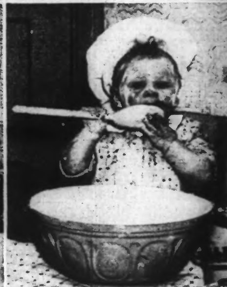
Ce jeune pâtissier a voulu montrer qu'en art culinaire, la valeur n'attendait pas le nombre des années. Il s'est essayé à composer un pudding de Noël. Il a cassé ses œufs, délayé sa farine et goûté sa pâte qui est peut-être excellente. Mais tout cela ne s'est pas passé sans dégâts.