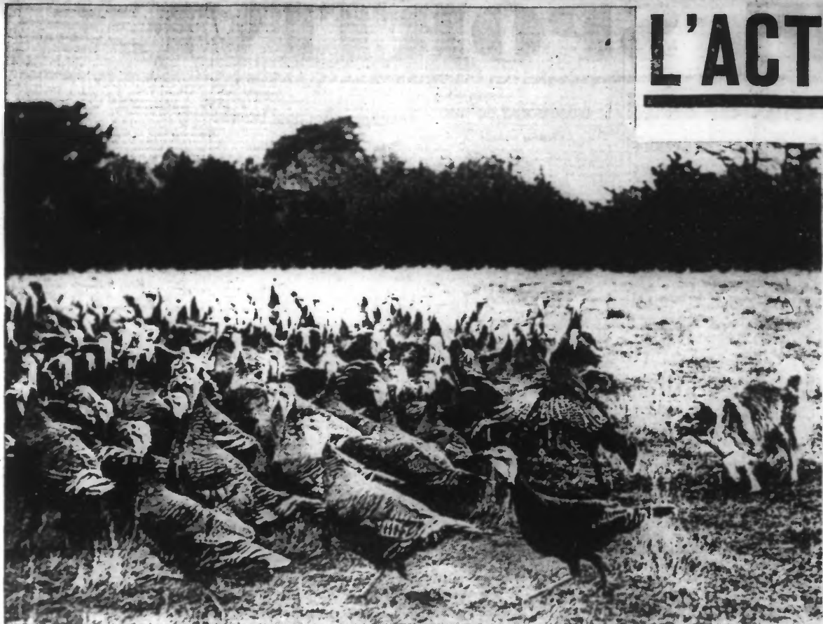
Un troupeau de dindes dans une ferme anglaise de l'Essex qui ont été jugées « bonnes pour le réveillon ». Mais apprécient-elles l'honneur qui leur est fait ?