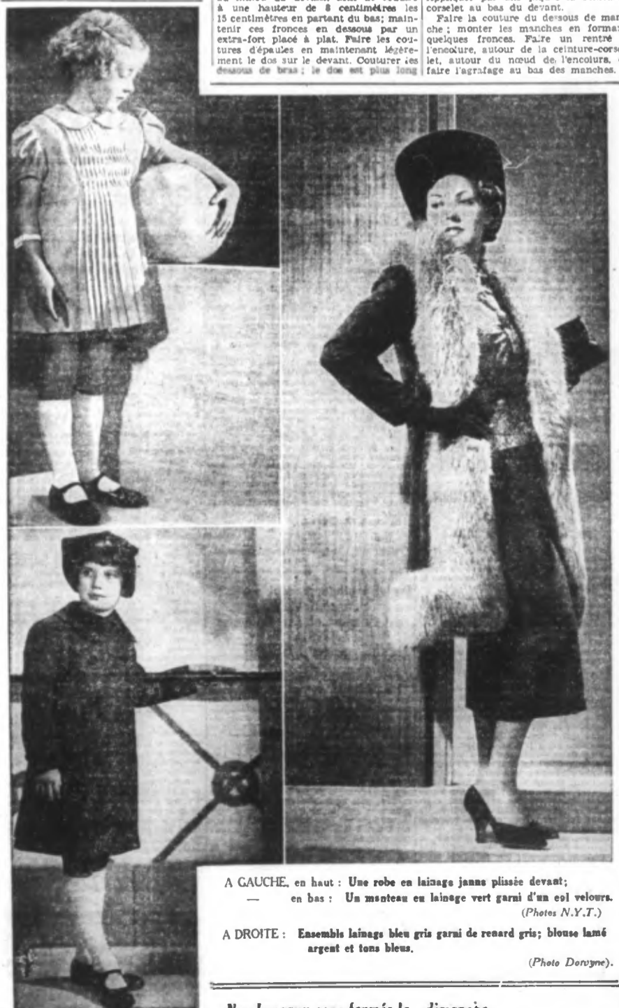
A GAUCHE, en haut : Une robe en lainage jaans plissée devant; en bas : Un manteau en lainage vert garni d'un col velours. A DROITE : Ensemble lainage bleu gris garni de renard gris; blouse lamé argent et tons bleus. Nos bureaux sont fermés le dimanche.

LYON LA DOUA (463 m.). — 12 h. 15: Informations. — 13 h. 15: Informations. — 14 h. 45: Informations. — 15 h. 30: Informations. — 16 h. 30: Informations. — 17 h. 30: Informations. — 18 h. 30: Informations. — 19 h. 30: Informations. — 20 h. 30: Informations. — 21 h. 30: Informations. — 22 h. 30: Informations.