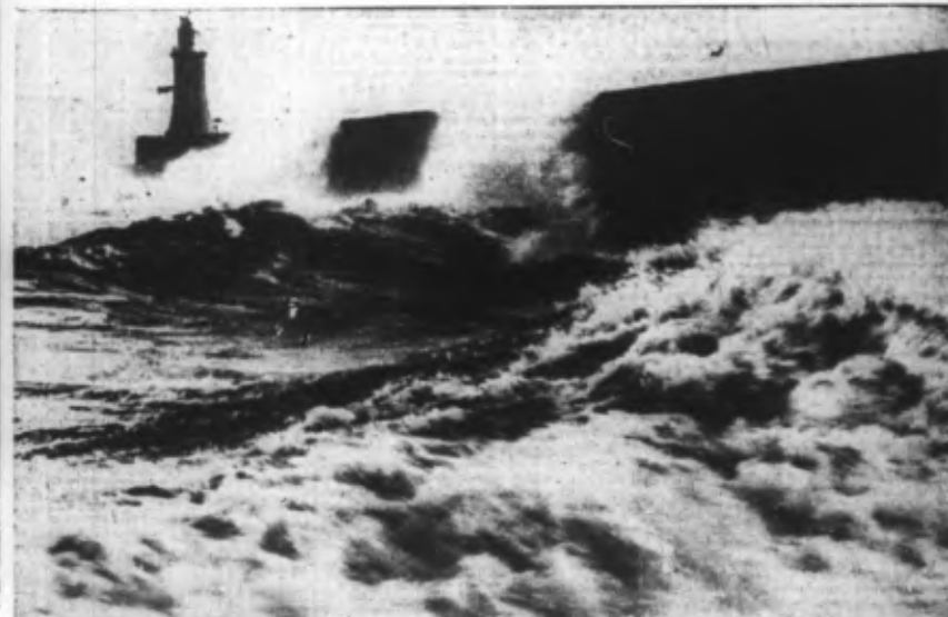
Les Iles Britanniques connaissent actuellement les grandes tempêtes d'hiver. Dans le Northumberland, la jetée de Tynemouth subit l'assaut des vagues en furie.