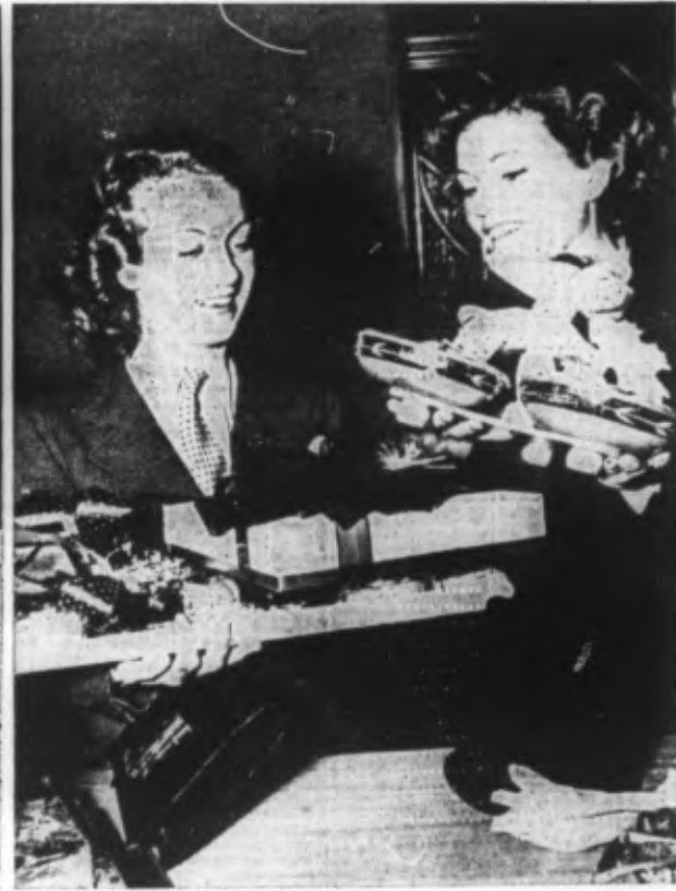
Deux vedettes françaises, Danièle Darrieux (à gauche) et Annabella, actuellement à Hollywood, ont fait leurs achats pour Noël.