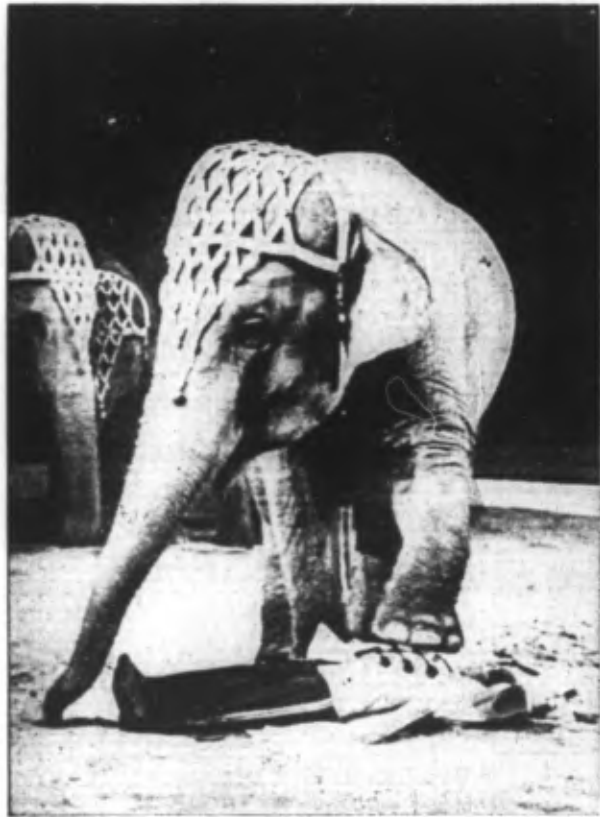
Quelle confiance ne faut-il pas à ce cornac pour se coucher entre les pattes de ces gigantesques animaux, à la merci d'une simple maladresse de ceux-ci.