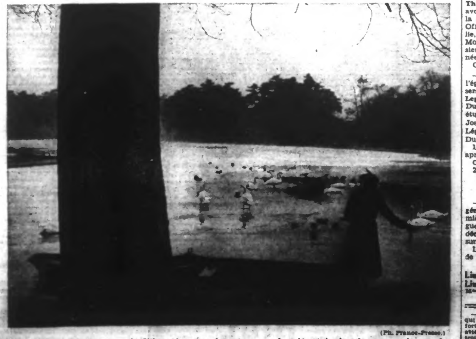
La lac du bois de Boulogne est gelé. Si le froid continue, les patineurs prendront bientôt la place des chiens et des canards.