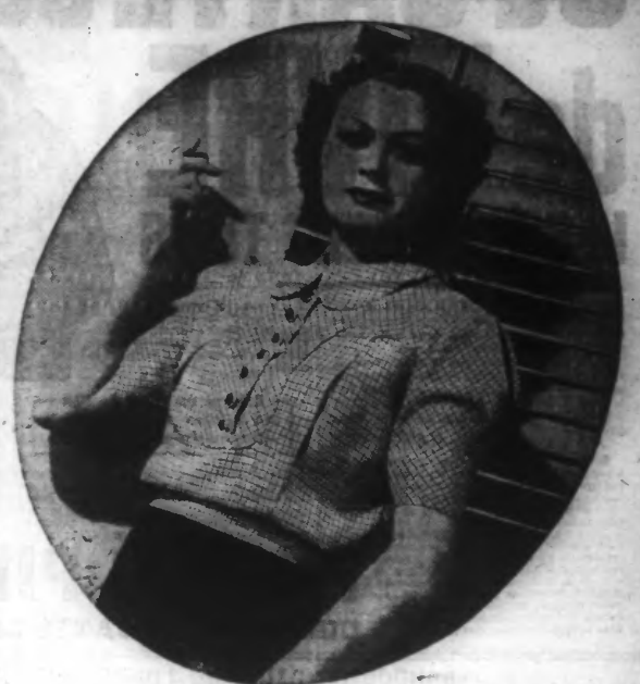
Blouse en toile quadrillée blanc, rouge et bleu.