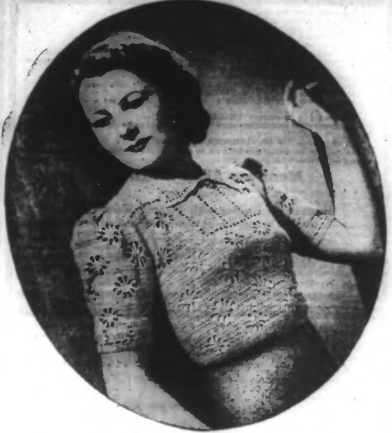
Blouse en tricot de coton vieux rose.