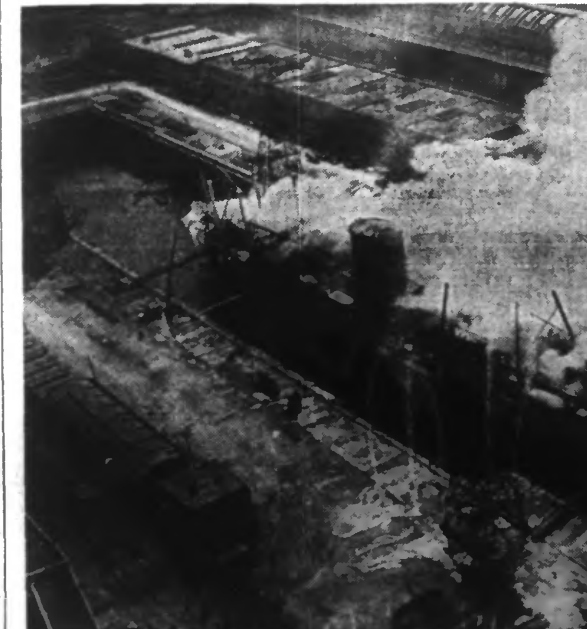
LE PAQUEBOT EN FEU