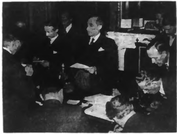
M. MARCHANDEAU FAISANT SA DÉCLARATION AUX JOURNALISTES.

Ce cours, atteint hier, ne sera pas dépassé a déclaré M. MARCHANDEAU