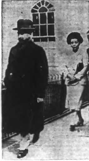
L'ex-empereur d'Éthiopie, qui villégiature actuellement à Brighton, la célèbre station balnéaire anglaise, a visité une exposition de peinture au Pavillon royal.