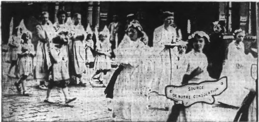
Le groupe de tête de la procession dans les rues de WASQUEHAL.