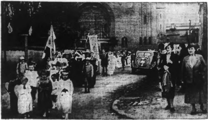
A ROUBAIX. — La procession sortant de l'église Notre-Dame de Lourdes.

PARTOUT, LES POPULATIONS Y PRENNENT UNE PART IMPOSANTE