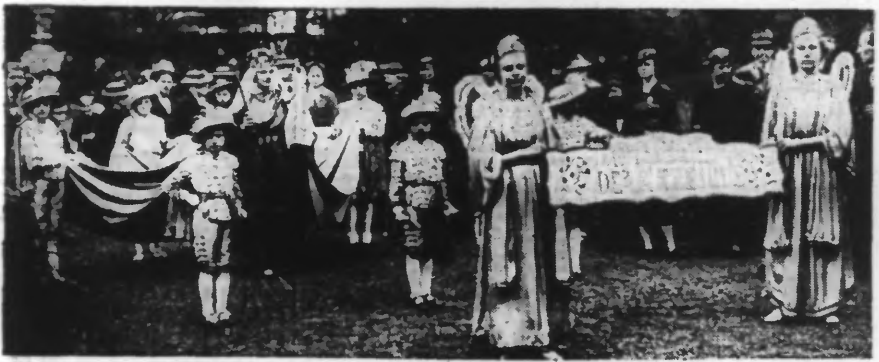
A ROUBAIX. — Le groupe Notre-Dame de la Treille, de la paroisse St-Martin.