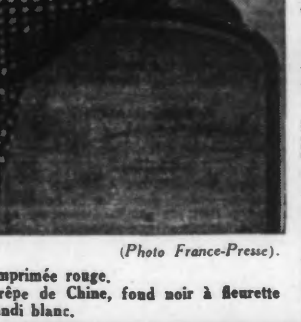
En haut: Robe en soierie noire, imprimée rouge. En bas: Robe d'après-midi en crêpe de Chine, fond noir à fleurette bleu roi; nœud d'organdi blanc.