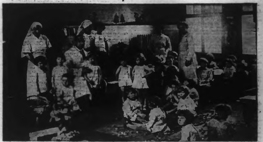
Le service médical scolaire à l'école maternelle Cognacq-Jay, au Pont-de-Marq.