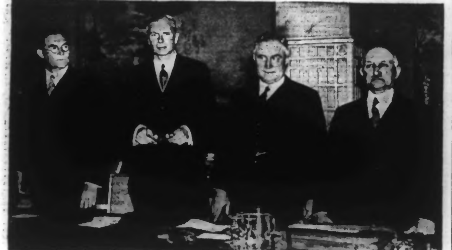
Le bureau de la séance d'ouverture de la XIV me Conférence lainière internationale de la laine à Londres