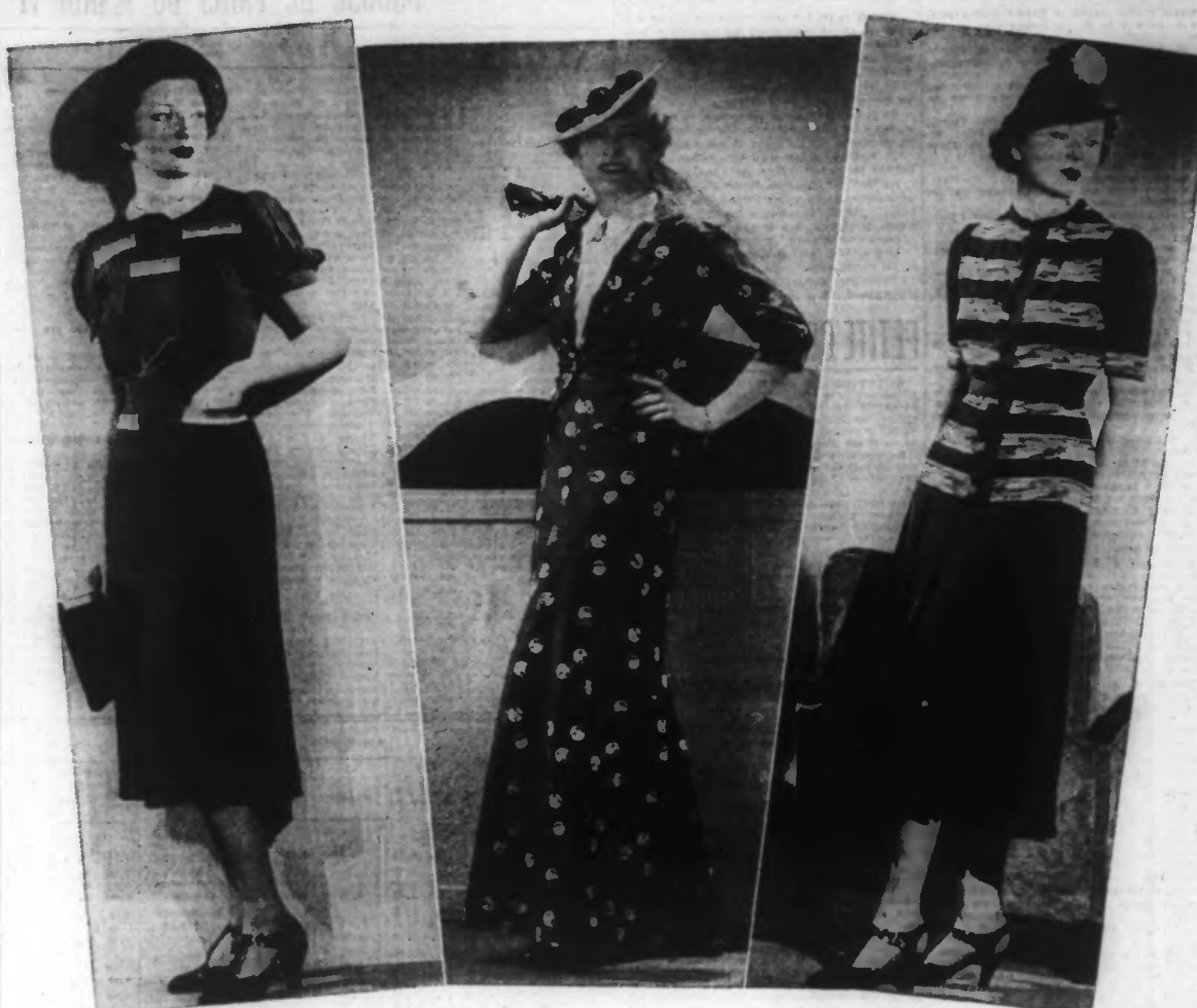
De gauche à droite : Robe d'après-midi, georgette marine; garniture rubans gros grains blanc et rouge. — Tailleur du soir en taffetas imprimé marine et blanc; blouse organdi blanc; chapeau paille blanche, garni noir avec voilette noire. — Ensemble deux-pièces marocain noir, bandes imprimées multicolores.