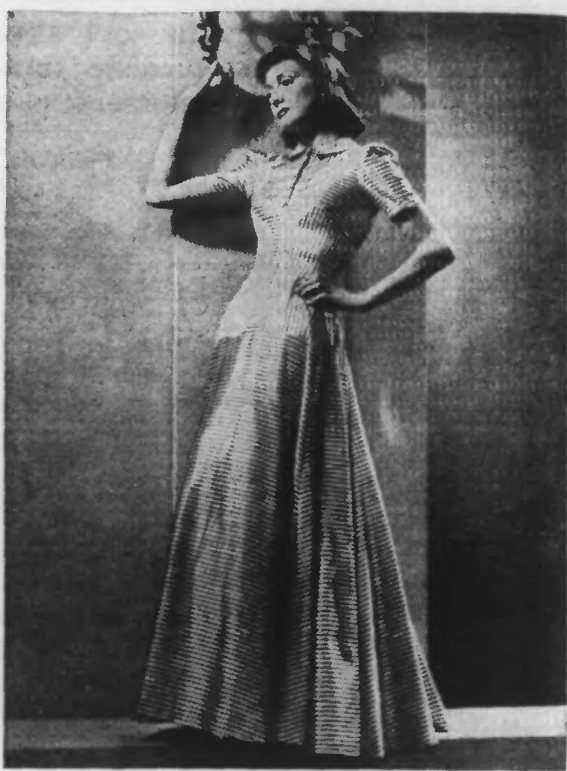
Robe du soir en satin rayé bleu et blanc.

Pelez et coupez en fines branches des pommes, des oranges et des bananes. Dans une coupe en verre, placez un lit de pommes, saupoudrez de sucre et arrosez de jus de citron; recouvrez les pommes d'une couche d'orange, saupoudrez de sucre et arrosez de jus de citron. Ajoutez ensuite les tranches de banane, saupoudrez de sucre et arrosez de citron. Préparez la salade au moins une heure avant de la servir et parfumez-la avec un vin de liqueur ou une liqueur, à votre choix.