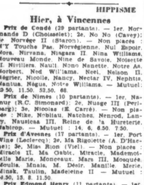
HIPPISE Hier, à Vincennes. Prix de Conde (29 partants) - 1er, Normand D (Chouan) 2e, Nino (Cavey) 3e...