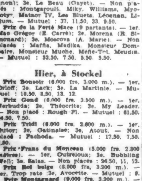
Hier, à Stockel. Prix Bonsoir (8.000 fr. 3.000 m.) - 1er, Orléan 2e, La Martinié 3e...