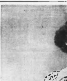
Blouse en laine tricotée à la main, marine et blanc.

Pour détruire les points noirs, faire chaque jour une application de la lotion suivante : 10 grammes de soufre sublimé, 20 grammes de glycérine et 180 grammes d'eau de roses.