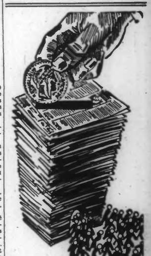
Le meilleur distributeur de clients.

Le réveil du Nouvel An fut, s'il est possible, plus réusé encore. Les tables étaient occupées par des groupes et des familles du meilleur monde. Le bal, extrêmement animé, fut conduit par l'excellent orchestre exténa, les Rhythm Kings, et par The Moochers, qui firent sensation.