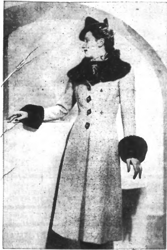
Redingote lainage beige garnie de castor.