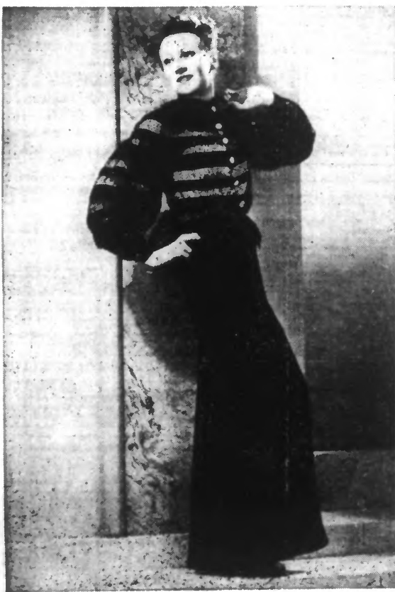
Robe de dîner en velours noir avec incrustations de dentelle noire. (Dorvyn.)