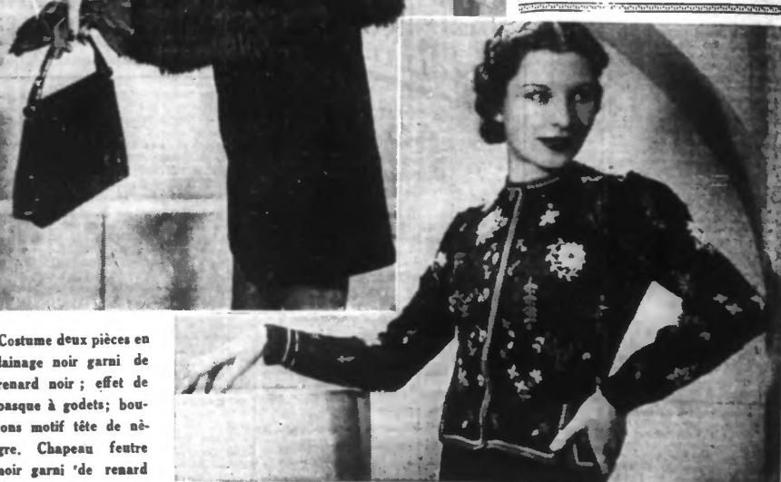
Paletot de laine tricoté à la main, rétrodi de fleurs multicolores.

Evitez donc de votre époque, essayez BLANCO (sachets et paquets bleu et blanc), et surtout, suivez rigoureusement le mode d'emploi, et vous ne pourrez plus vous en passer. 44032