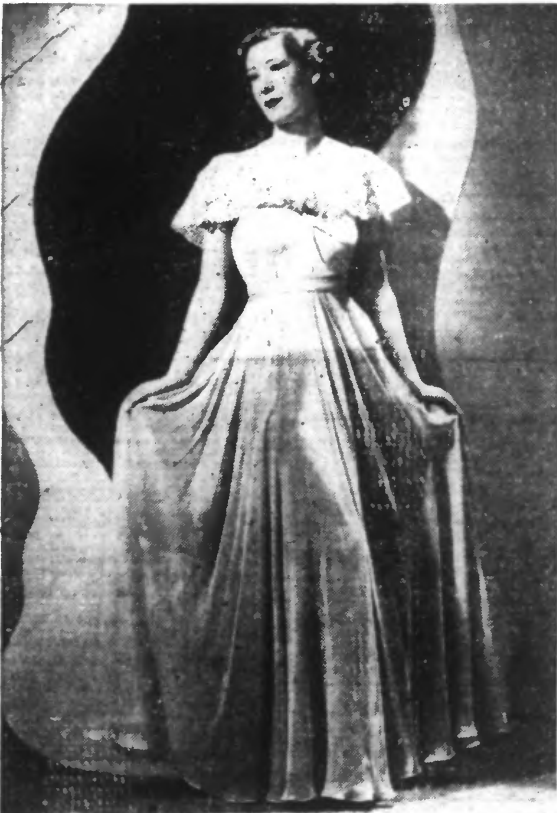
Robe de soir en mousseline de soie bleu clair sur fond, dont le haut est rose et le bas bleu plus foncé; grand col en dentelle blanche, fleurs blanches et roses. (Dorvyn.)