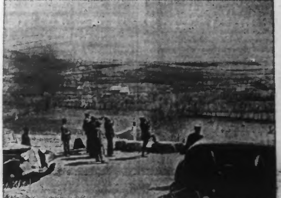
LE PRÉFET DES PYRÉNÉES-ORIENTALES EN TOURNÉE D'INSPECTION, PRÈS DE BOURG-MADAME, A LA FRONTIÈRE CATALANE.