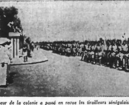
Le gouverneur de la colonie a passé en revue les tirailleurs sénégalais qui sont arrivés récemment en renfort.