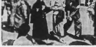
LE DÉPART POUR LE FRONT DE NOUVELLES RECRUES A BARCELONE.