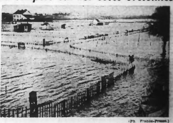
LA CAMPAGNE NANTAISE INONDÉE PAR LA CRUE DE LA LOIRE.