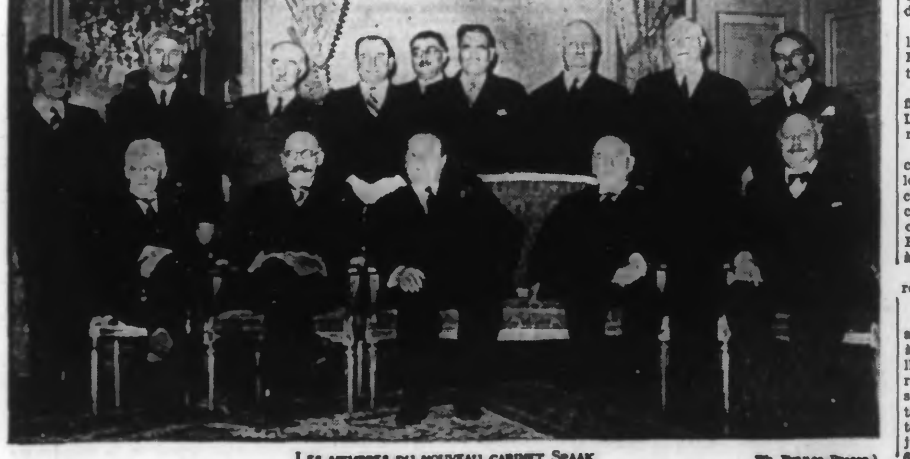
LES MEMBRES DU NOUVEAU CABINET SPAAK

Vertical text on the left edge of the page.