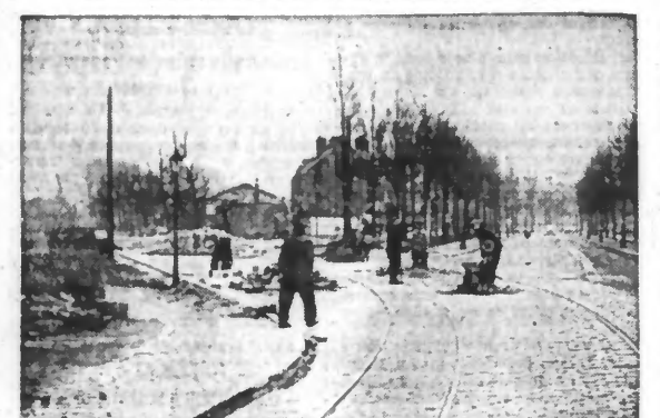
L'ACHÈVEMENT DES TRAVAUX A PROXIMITÉ DU PONT HYDRAULIQUE.

Depuis quelque temps, des ouvriers spécialisés travaillent à l'aménagement de deux chaussées latérales sur le boulevard de la Marne, entre les « Trois Buissons » et le pont hydraulique. Ces travaux sont actuellement très poussés et, même en plusieurs endroits, achevés, ainsi qu'on peut s'en rendre compte par notre photographie. Il faut tout particulièrement souligner les améliorations réalisées aux abords du pont hydraulique où, les chaussées étaient déplorables et n'auraient pas pu résister à ce que l'on y réalisa, afin que la circulation puisse s'y établir dans les meilleures conditions.