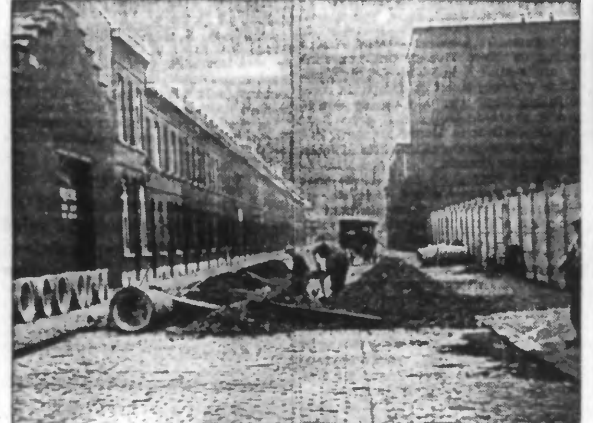
L'ÉTAT DES TRAVAUX

Des travaux sont actuellement en cours, rue du Moulin-Tonton, où des ouvriers procèdent à la pose d'un aqueduc reliant ainsi ce système d'égouts à celui qui passe dans la rue de Toulouse. Notre photographie représente un aspect de ces travaux.