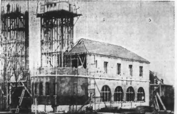
LE PAVILLON DE LA MOSELLE, EN VOIE D'ACHEVEMENT

Plusieurs pavillons dressent leur ossature au Parc Barbieux. Le pavillon de la Moselle, en voie d'achèvement. Le pavillon de la Somme, dressé l'ossature de deux clochetons. Au premier plan: le pavillon du Haut-Rhin, en construction.