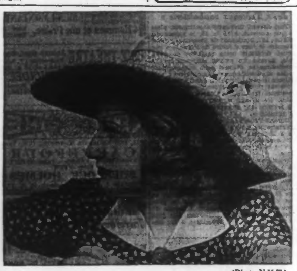
Capeline en panama blanc, gros grain bleu marine.

Cette charmante blouse rayée est exécutée en laine bouclée de trois couleurs avec des aiguilles de 3 mm 1/2. Le travail est fait entièrement en rayures alternées ainsi: