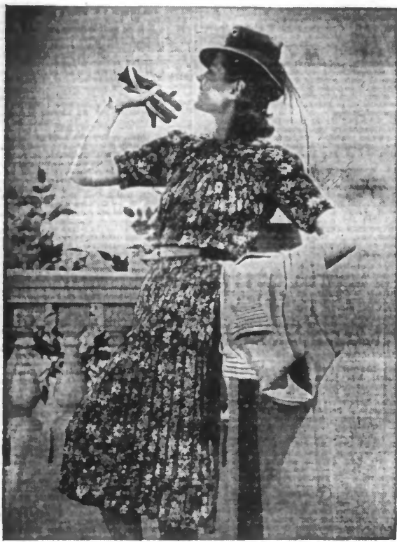
Robe en chiné plissé, imprimé noir et couleurs vives, manteau en lainage beige. (Dorvina)