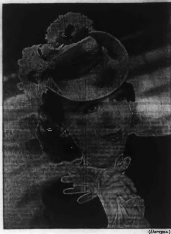
Chapeau piqué blanc façonné avec fleurs blanches et rouges; voilette rouge. (Dorvina)

Les cheveux ternes ou raides deviennent étonnamment transparents, soyeux et souples après un lavage au shampooing Roja. — à base d'huile de ricin. — Diluez, dissolvez et entretenez les impuretés; agit comme un bain d'huile, vivifie les cheveux. Essentiel de la toilette. — le shampooing Riciné Roja de ce soir: 2 francs, partout.