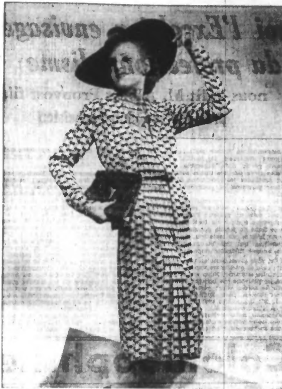
Ensemble en crêpe mat, imprimé de marguerites, empiècement en tulle rebrodé de marguerites.