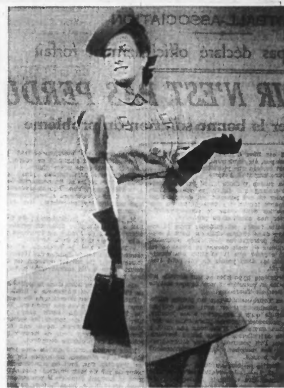
Robe en lainage vert, garnie de bandes de cuir marron.