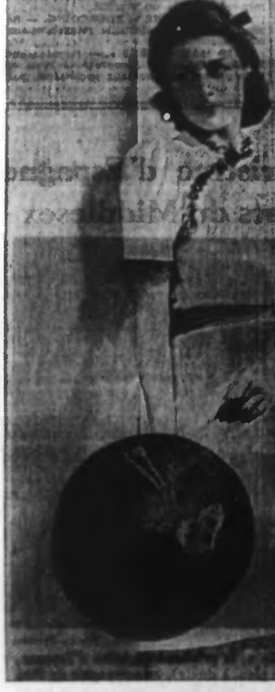
Robe de jersey blanc, garnie de dentelle noire, ceinture en soie bordeaux et verta.