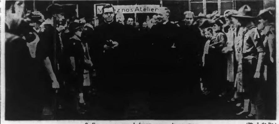
S. E. M. LE CARDINAL LIÉNART VISITE L'EXPOSITION