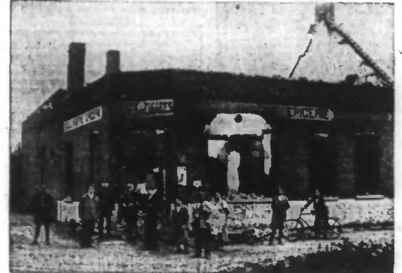
LES RUINES DE LA MAISON INCENDIÉE.

La cause du sinistre est inconnue. Cependant, la découverte de traces suspectes motive une descente du Parquet