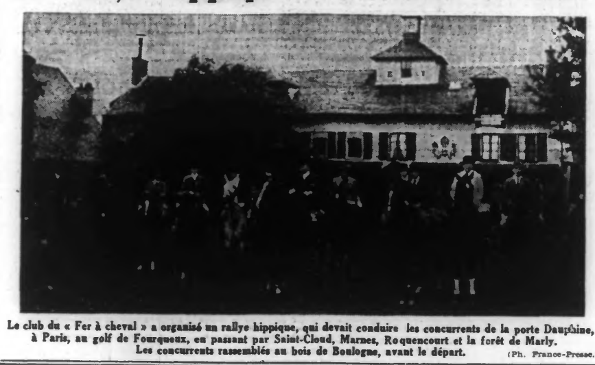
Le club de « Fer à cheval » a organisé un rallye hippique, qui devait conduire les concurrents de la porte Dauphine, à Paris, au golf de Fourqueux, en passant par Saint-Cloud, Marigny, Roquencourt et la forêt de Marly. Les concurrents rassemblés au bois de Boulogne, avant le départ.