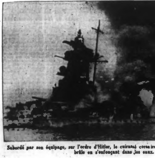
Saboté par son équipage, sur l'ordre d'Hitler, le cuirassé corsaire allemand « Graf-von-Spee » brûle en s'enfonçant dans les eaux.

VEE 221, rue 317.50, moderne, C48012 TOURCOING 26.913 BOULVAZ 27.644 BAT. ARMES DAT 1 FOIE 1 FATS rapide, moderne, de 37.900 Hessels, C23809 DUX ARGENT Fêtes UDRE nouf. 600, de 185 fr., C1284 Roubaix iennes williams, décorées C23809 icité dre! résul- uz rai- ouches? plus e de ez dans