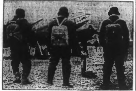
Les moteurs sont chauds, l'équipage va monter à bord et partir pour une mission de reconnaissance.