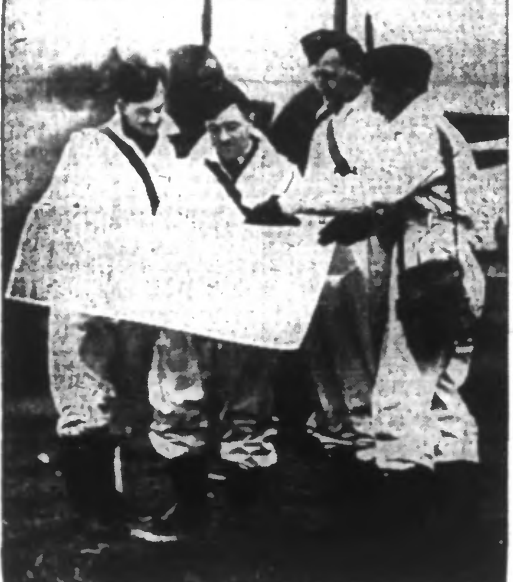
Dès leur débarquement en Angleterre, les aviateurs australiens se sont mis à l'entraînement. Ph. S.A.P.A.R.A. (A.2424)

En Anatolie, les inondations sont plus graves encore qu'on ne l'avait cru Ankara, 2 janvier. — Les inondations en Anatolie occidentale sont plus sévères qu'on ne l'avait cru d'abord. Les plaines de la Manisa (Brousse), de Menemen et d'Amasya sont entièrement sous les eaux. Les communications ferroviaires, téléphoniques et télégraphiques sont coupées et les maisons démolies. Le premier train de grands blessés venant d'Erzincan est arrivé hier à l'hôpital de la capitale. Des sauveteurs et des bataillons de génie ont apporté des secours par camions, barques et canots-automobiles. On estime à mille au minimum le nombre des noyés. Les inondations en Asie Mineure. La ville de Brousse, où le tremblement de terre et les inondations ont causé de grands ravages.