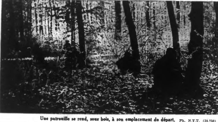
Une patrouille se rend, sous bois, à son emplacement de départ.