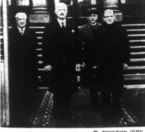
MM. Albert Lebrun et Daladier quittent l'Élysée pour le Luxembourg et le Palais-Bourbon, où ils vont rendre leur visite de Noël. An aux présidents du Sénat et de la Chambre.