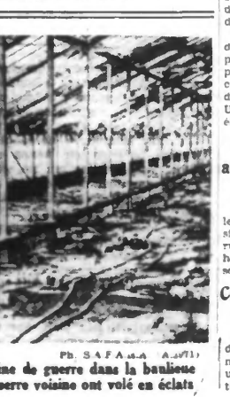
P. SAFARA (4/271)