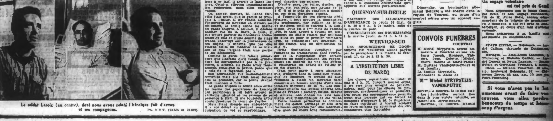
Le soldat Laroix (au centre), dont nous avons relaté l'héroïque fait d'armes et ses compagnons.