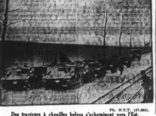
Des tracteurs à chenilles belges s'acheminent vers l'Est.

Les tarifs actuellement en vigueur sur les produits de la condition publique ont été modifiés à partir du 1er mai 1940.