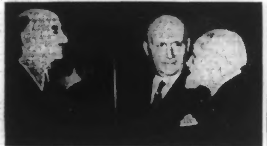
Le Conseil municipal de Paris est suspendu jusqu'au 31 janvier 1941. Pendant cette période, le pouvoir sera exercé par MM. Charles Magry, préfet de la Seine et R. Langeron, préfet de police.

Le nouveau régime administratif de la ville de Paris