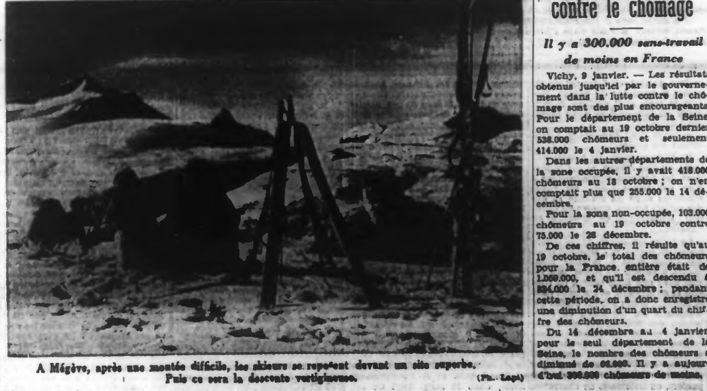
A Mégève, après une montée difficile, les skieurs se reposent devant un site superbe. Pais ce sera la descente vertigineuse.

Entre le coucher du soleil CE SOIR, à 18 heures 13 et son lever DEMAIN à 9 heures 43 l'obscurcissement des lumières doit être TOTAL