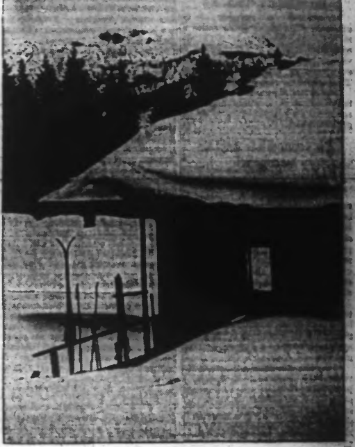
...celle revêtue par ce chalet perdu dans les Alpes. Dans le Dauphiné, des hordes de sangliers dévalent dans les villages et les loups rôdent Grenoble, 9 janvier. — Dans certaines régions du Dauphiné, des troupes de loups se sont avancées à proximité des habitations et on a vu des hordes entières de sangliers traverser les villages.