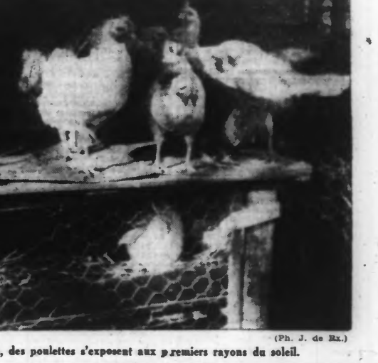
Juchées sur des cages à lapins, des poulettes s'exposent aux premiers rayons du soleil.

La basse-cour donne aux éleveurs des résultats qui sont toujours fort intéressants. À l'approche de la mi-Janvier, toutes les poulettes doivent pondre. Si elles ne le font pas, les éleveurs bien souvent en sont responsables ; leurs couvées étaient trop tardives, ou les volailles sont trop nombreuses pour leur logement, ou encore ce logement est mal conçu ou mal entretenu et la nourriture n'est pas restreinte. Contrairement à ce que l'on pense, il ne faut pas croire que le froid gèle beaucoup les poules ; il faut plutôt éviter les courants d'air et surtout l'humidité aux pattes. Pour aujourd'hui, recommandons aux candidats-éleveurs de s'approvisionner en graines nécessaires pour maintenir en bon état leurs précédentes pondeuses.