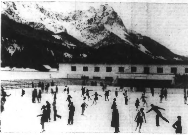
La piste de patinage de Garmisch-Partenkirchen, où se déroulent les championnats de sports d'hiver.