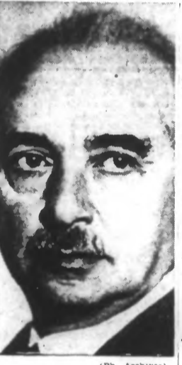
M. Ismet Inonu

Istanbul, 4 mars. — Radio-Ankara annonce que M. von Papen, ambassadeur du Reich, a été reçu par le président de la République turque, dans son château de Tchankay. L'ambassadeur était porteur d'un message personnel du Führer, message qui avait été apporté par un avion spécial. Le Président a écouté le message avec la plus grande attention et a prié l'ambassadeur de transmettre ses remerciements au Führer pour son geste aimable. M. Saradjoglou, ministre turc des affaires étrangères, assistait à l'entretien. (Lire la suite page 2).