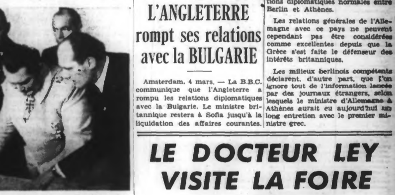
Le maréchal du Reich Goering visite les usines d'aviation allemande. A sa droite, on reconnaît le professeur Messerschmitt.