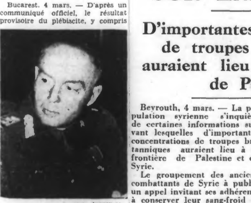
Le général Antonescu

Bucarest, 4 mars. — D'après un communiqué officiel, le résultat provisoire du plébiscite, y compris