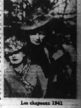
Les chapeaux 1941