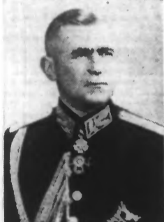
Le général Todol Dasalof, ministre de la guerre de Bulgarie

Berlin, 4 mars. — Les raisons qui ont incité les troupes allemandes à entrer en Bulgarie ont, une nouvelle fois, été clairement expliquées dans les milieux politiques berlinois. On dit que les mesures allemandes prises dans le sud-est de l'Europe étaient basées, en réalité, sur deux principes : le premier est caractérisé par la volonté d'établir et de garantir pour toujours, dans cette région, une paix durable et un ordre stable; le second dépend du point de vue de la guerre contre l'Angleterre, une guerre dans laquelle l'Allemagne, comme le Führer l'a déclaré, frappera l'Angleterre partout où celle-ci peut être rencontrée. On fait remarquer de nouveau du côté allemand que l'Allemagne empêchera toute tentative de la part de l'Angleterre d'étendre la guerre à des régions que l'Allemagne considère comme faisant partie de sa sphère économique. On ajoute que ces deux principes élémentaires sont à la base des amitiés du Reich, tout comme l'or-