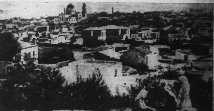
Le port de Candie, le plus important de l'île de Crète.

Berlin, 30 avril. — Poursuivant de près les Anglais en déroute, les troupes allemandes ont atteint les ports situés dans le sud du Péloponnèse. On souligne dans les milieux autorisés de Berlin que la campagne de Grèce pourra être considérée