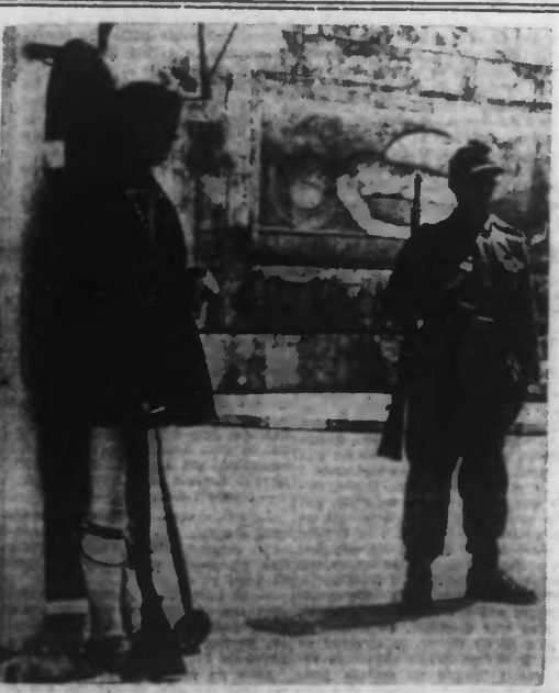
Un soldat de la garde royale grecque et un chasseur alpin allemand montent la garde devant le monument au soldat inconnu à Athènes.