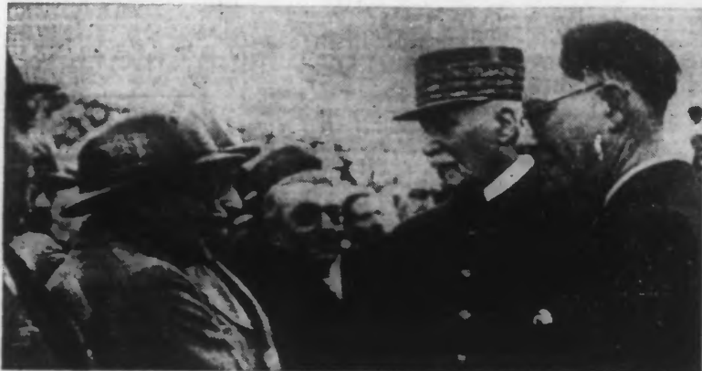
Le Maréchal en conversation avec un mineur.

Vichy, 1 er mai. — Voici les principaux passages du discours radio-diffusé que le maréchal Pétain a prononcé à Commentry, spécialement à l'intention de la population ouvrière : Jusqu'à présent, le 1 er mai a toujours été en France un symbole de dissidence et de haine. A l'avenir, ce sera un symbole d'unité et de camaraderie car ce sera la fête du travail et de tous les travailleurs. Il est impossible de construire une grande nation sur les bases d'un privilège ou sur les faveurs du destin, mais au contraire, il faut établir les fondements sur le travail incessant de la communauté populaire tout entière. Un chef d'industrie, un patron, pour mériter le commandement dont il est investi, doit se considérer comme ayant charge d'existence, et même ayant charge d'âmes. Il doit avoir le souci de la dignité, du bien-être, de la santé, du moral de ses collaborateurs et