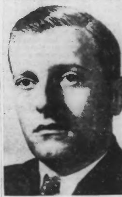
M. Abetz

Vichy, 3 mai. — L'amiral Darlan a quitté Vichy pour Paris, où se poursuivent les conversations amorcées récemment avec les représentants de l'Allemagne. C'est dans la nuit que fut décidé le départ soudain pour Paris de l'amiral Darlan. L'ambassadeur du Reich en France, M. Otto Abetz, est arrivé, en effet, vendredi soir dans la capitale française. L'amiral Darlan s'est rencontré samedi avec M. Abetz. Le Conseil des ministres qui devait se tenir à la fin de l'après-midi à l'hôtel du Parc, sous la présidence du maréchal Pétain, a été ajourné en raison du départ de l'amiral Darlan.