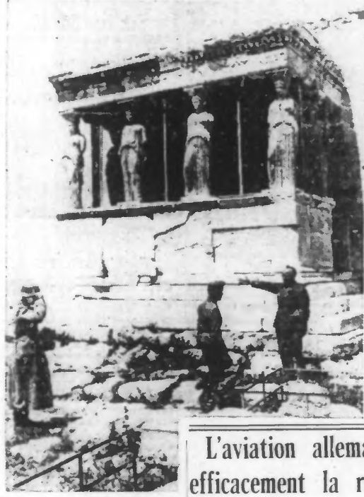
Les premiers soldats allemands sur l'Acropole, après la prise d'Athènes.