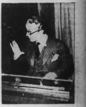
Reconnaissez-vous Noël-Noël ? Le populaire artiste de l'écran redevient chanteur. Le voici, s'accompagnant au piano

Une tentative de détachements motorisés britanniques d'occuper par la force le poste de Roubta et l'aérodrome y adossés, situés à l'ouest de l'Irak, à égale distance des frontières de Syrie, de Transjordanie et de l'Arabie séoudite, a été enrayée et repoussée. L'ennemi a abandonné sur le lieu du combat plusieurs tanks détruits. Un troisième communiqué irakien annonce que l'armée s'est emparée de tous les gisements pétroliers et raffineries de Kirkuk, Khanikin et Geyara, ainsi que de toutes les stations et conduites du pipe-line. Un autre communiqué signale que, dans la région occidentale, les troupes irakiennes poursuivent l'encercllement de l'aérodrome de Cinedebane. L'artillerie à canon Cinedebane : des réservoirs de pétrole ont été incendiés et des explosifs se sont produits dans les dépôts de munitions. Dans le sud du pays, activité de l'artillerie de part et d'autre.