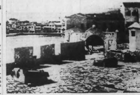
Le port de La Canée, capitale politique de l'île de Crète.

Berlin, 3 mai. — Les prisonniers britanniques qui ont dû se rendre par unités entières au cours de ces deux derniers jours, près de la côte sud du Péloponnèse, ont déclaré, à l'unanimité, lors de leur interroga-