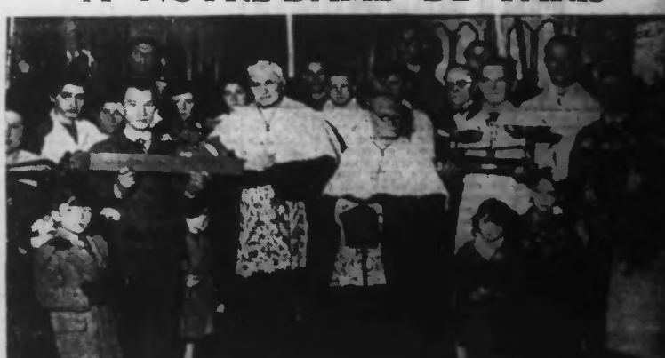
Les cardinaux Suhard et Baudrillard, entourés de jeunes artisans porteurs de divers instruments de travail.