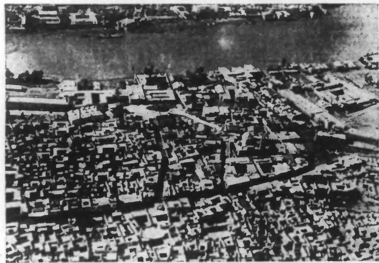
Une vue aérienne du Tigre et de Bagdad, prise à 5.000 mètres d'altitude

Dans les milieux autorisés de Bagdad, on déclare que le pays est en état de se défendre seul contre l'invasion britannique