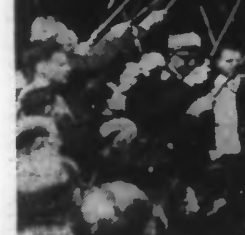
A Montluçon, le Maréchal quitte l'hôtel de ville et passe sous la haie formée par les Compagnons du devoir du Tour de France

— La Bulgarie a célébré aujourd'hui la fête de saint Georges, patron de l'armée et de l'ordre de la bravoure. A cette occasion ont eu lieu une cérémonie religieuse et militaire à laquelle ont assisté le roi et tous les dignitaires de l'Etat.