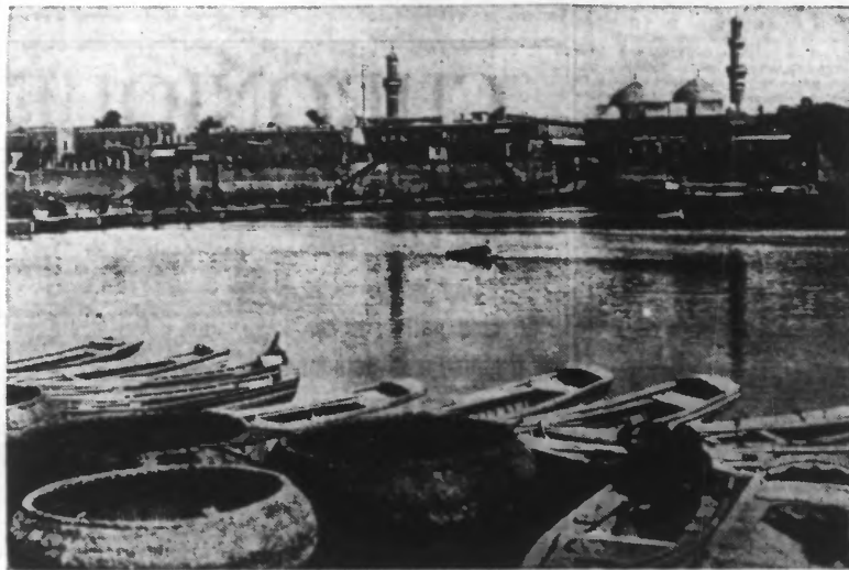
Une vue de Bagdad, capitale de l'Irak.

Le gouvernement de M. Raschild El Kalaini, dans sa réponse à l'Égypte, refuse d'envisager la possibilité d'un compromis avec l'Angleterre