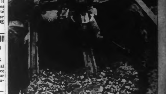
Les troupes motorisées allemandes ont dû surmonter de grandes difficultés au cours de leur avance en Grèce.

New-York, 7 mai. — D'après les informations parues dans la presse canadienne, sir Edward Ellington, maréchal de l'air britannique, a déclaré à Manchester que l'aviation britannique éprouvait les plus grandes difficultés dans le recrutement de son personnel. D'autre part, les endroits appropriés à la création d'aérodromes devenaient de plus en plus rares dans les îles britanniques.