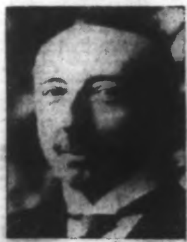
M. Léon Bérard