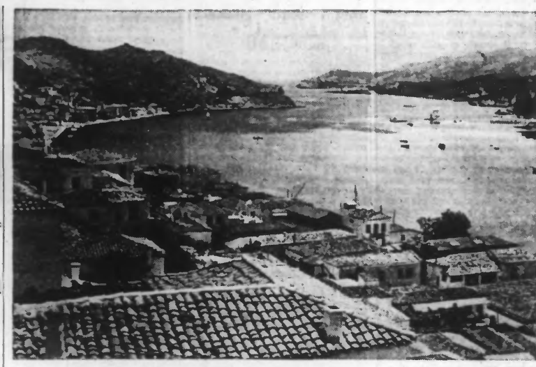
Paleo Castro, dans l'île de Milo, qui vient d'être occupée par les Allemands.

Elle a remis à celui-ci un manifeste dont M. Caziot, ministre de l'Agriculture, a donné lecture au maréchal. Ce manifeste exprime au chef de l'Etat la confiance qu'il défendrait les intérêts primordiaux de la paysannerie. La paysannerie jure fidélité à la personne du maréchal, défenseur des classes paysannes. Le manifeste termine en déclarant que les paysans travailleront de toutes leurs forces au relèvement de la patrie meurtrie et qu'ils feront de leurs enfants des Français profondément attachés au travail de la terre, à la grandeur de leur pays. Le maréchal a exprimé ses profonds remerciements à la délégation. Celle-ci a remis ensuite au chef de l'Etat un dessin symbolisant la promesse faite par la paysannerie française et comprenant 1.250.000 signatures. A la fin de l'entretien, M. Caziot a annoncé à la délégation l'initiative qu'il avait prise, d'accord avec le maréchal Pétain, de célébrer prochainement le troisième centenaire de la mort de Sully et d'établir dans l'ancien château du ministre français le musée de la paysannerie française.