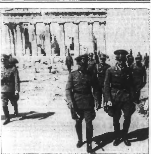
Le général von Brauchitsch visite l'Acropole.

L'Allemagne et l'Italie suivent une ligne commune Vichy, 13 mai. — Les milieux italiens déclarent au sujet des relations entre la France et les puissances de l'Axe qu'aucun fait ne s'est produit pour le moment, en dehors de l'accord par lequel le Reich a réduit fortement les frais d'occupation à la charge de la France. « L'Allemagne et l'Italie, ajoutent-ils, suivent la ligne commune arrêtée par MM. Hitler et Mussolini lors de leurs rencontres ».