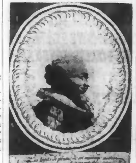
Sully (Portrait à la plume)

Vichy, 14 mai. — Une délégation d'agriculteurs et de vigneronns de la zone non occupée, conduite par le