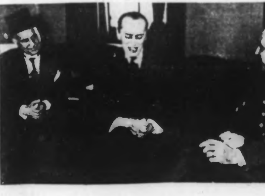
M. Douglas Hyde, président de l'Etat libre d'Irlande

A MADAGASCAR Tananarive, 27 mai. — Le loyalisme des populations indigènes de Madagascar vient de se manifester de nouveau par la voie de leur représentant au Conseil supérieur de