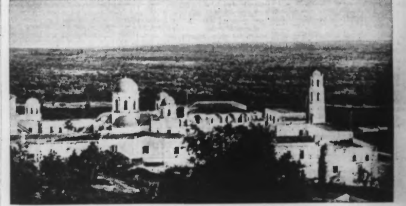
Le couvent de la Sainte-Trinité de Zancarlo, dans l'île de Crète

Vichy, 27 mai. — L'amiral Darlan est parti par train spécial pour Paris, où se trouvent déjà trois autres ministres français: le général Huntziger, ministre de la guerre; M. Bouthillier, ministre de l'économie nationale et des finances; et M. Caziot, ministre de l'agriculture. Les entretiens continuent avec les autorités allemandes.