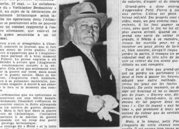
M. Henri Haye, ambassadeur de France, remis à M. Sumner Welles, une note qui réaffirme que la France ne cédera sa flotte ou ses colonies, ni à l'Allemagne, ni à aucune autre puissance.

LA FRANCE ne cédera sa flotte ou ses colonies à aucune puissance dit une note officielle remise à Washington Paris, 27 mai. — Le communiqué officiel remis à Washington par le gouvernement français affirme que la France ne cédera sa flotte ou ses colonies à aucune puissance.