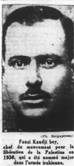
Fanzî Kandjî bey, chef du mouvement pour la libération de la Palestine en 1936, qui a été nommé major dans l'armée irakienne.

Les instructions de l'amiral Darlan aux directeurs de l'inscription maritime Vichy, 28 mai. — L'amiral Darlan vient d'adresser aux directeurs de l'inscription maritime une circulaire dans laquelle il les prie de faire à tous les pêcheurs les recommandations suivantes concernant l'exercice de leur métier: « Le ravitaillement du pays est à l'heure actuelle un devoir patriotique pour les pêcheurs. Je demande donc à tous de s'y consacrer exclusivement, dans la limite des moyens et des obligations que les circonstances actuelles rendent nécessaires, et malgré des difficultés dont je ne méconnais pas l'étendue. « Que chacun comprenne que le meilleur moyen de suivre la voie nationale tracée par le Maréchal est d'exercer honnêtement son métier en s'y donnant avec courage et abnégation. »