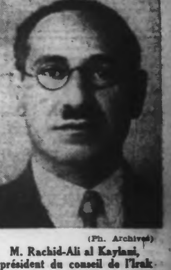
M. Rachid-Ali al Kaylani, président du conseil de l'Irak