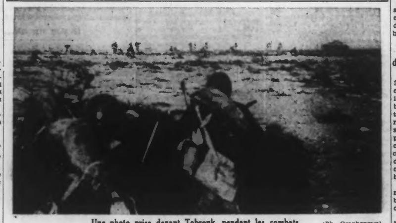
Une photo prise devant Tobrouk, pendant les combats.

Berlin, 28 mai. — Au cours de la matinée de mercredi des avions de combat allemands ont attaqué une puissante escadre de la flotte anglaise à l'ouest de l'Irlande du Nord et ont infligé de graves pertes aux forces navales ennemies. Un destroyer a été bombardé et a coulé. D'autre part, une bombe de grand calibre a touché un croiseur dont la force combattive a été sérieusement diminuée.