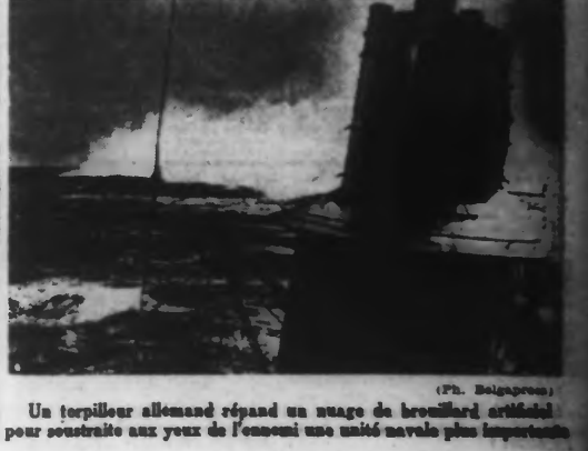
Un torpilleur allemand répand un nuage de brouillard artificiel pour soustraire aux yeux de l'ennemi une unité navale plus importante

Vichy, 28 mai. — Le chef de l'Etat vient de décider la création d'une commission chargée de l'étude de l'équipement national et de proposer toutes les mesures propres à accélérer et à mettre en vigueur une pratique nouvelle de constructions immobilières.