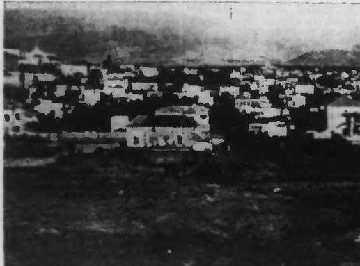
Le quartier Mazraa, à Beyrouth. Au fond, les montagnes du Liban.

Le gouvernement libanais fait confiance à la puissance mandataire pour la sauvegarde de la paix, la sécurité et la défense de ses frontières