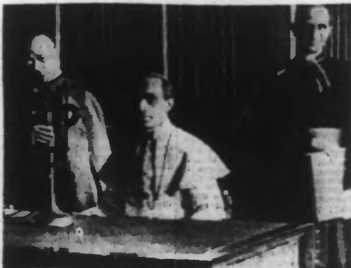
St. Sainteté Pie XII prononçant son message radiodiffusé

L'anniversaire de l'encyclique « Rerum novarum »