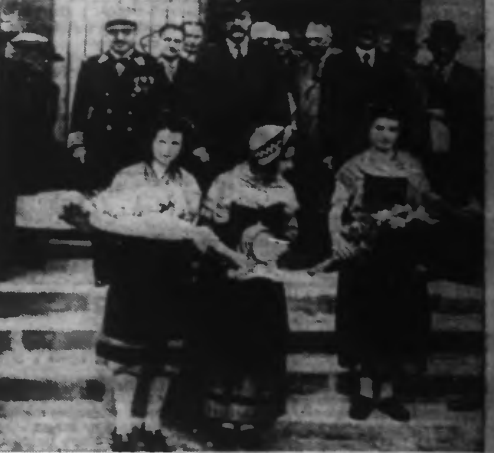
M. Casiot, ministre de l'Agriculture, accompagné du préfet de l'Allier, quitte les halles de Saint-Pourçain, précédé d'un groupe de jeunes filles en costume régional.