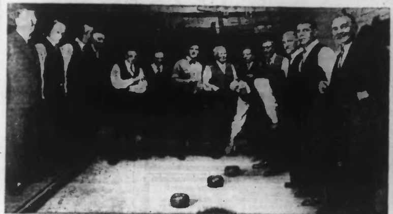
Nous avons annoncé l'ouverture du tournoi de boules de la ville de Tourcoing, entre toutes les sociétés de la Fédération de boules et doté de cinq mille francs de prix. Ce tournoi se joue au bénéfice des prisonniers. Voici, dimanche, à la boulerie Sainte-Anne, rue du Brum-Pain, l'équipe Saint-Paul de la Belle-Vue et l'équipe des Poilus d'Orion ouvrant le jeu.