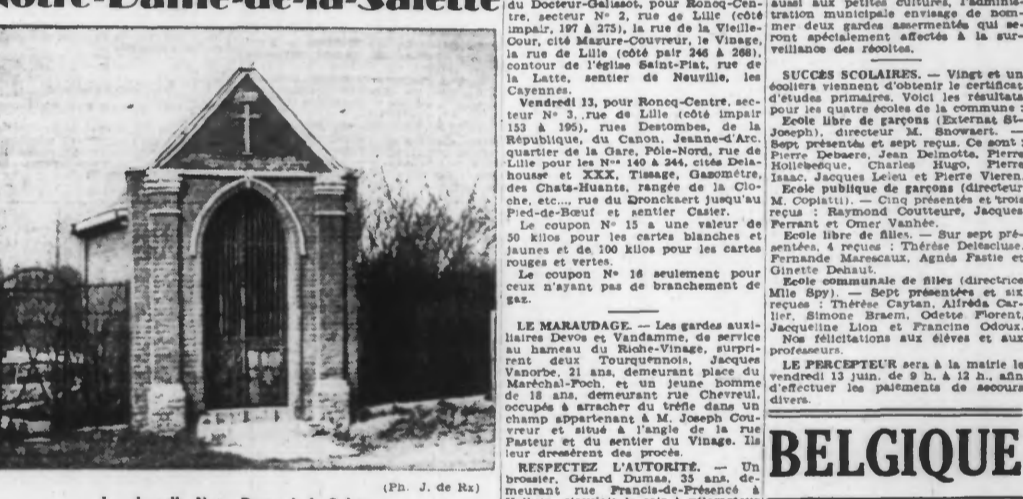
La chapelle Notre-Dame-de-la-Salette.

C'est une chapelle aux formes rectilignes et sans coquetterie, qui se dresse sur Mac-Mahon, à proximité de la ferme Lepers, dont elle est la propriété.