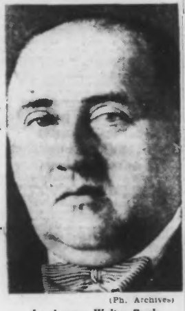
Le docteur Walter Funk

M. WALTER FUNCK ministre de l'économie du Reich