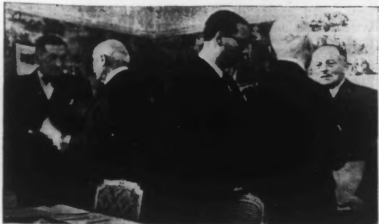
Au Conseil des ministres. A gauche, le maréchal Pétain. A droite, M. Belin, ministre du travail; le général Huntziger (de dos), ministre de la guerre et le général Weygand.